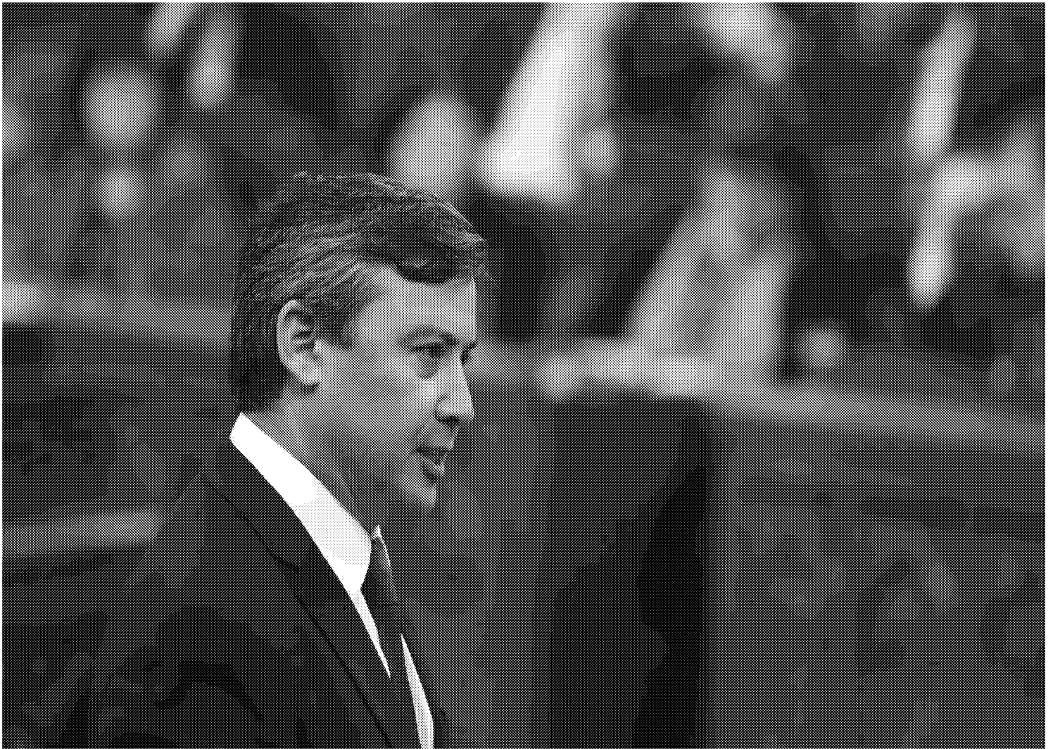
Le député conservateur de Wellington-Halton Hills, Michael Chong